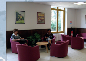
Espace détente et coin «Enfant»