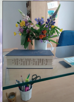
ACCUEIL des gîtes