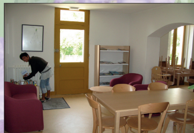
Espace Salle à manger commune