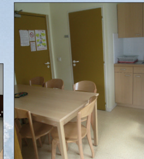
Cuisine équipée dans les logements